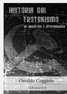
Osvaldo Coggiola Historia del trotskismo en Argentina y Latinoamérica