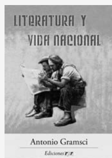
Antonio Gramsci Literatura y vida nacional