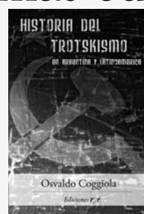
Osvaldo Coggiola Historia del trotskismo en Argentina y Latinoamérica